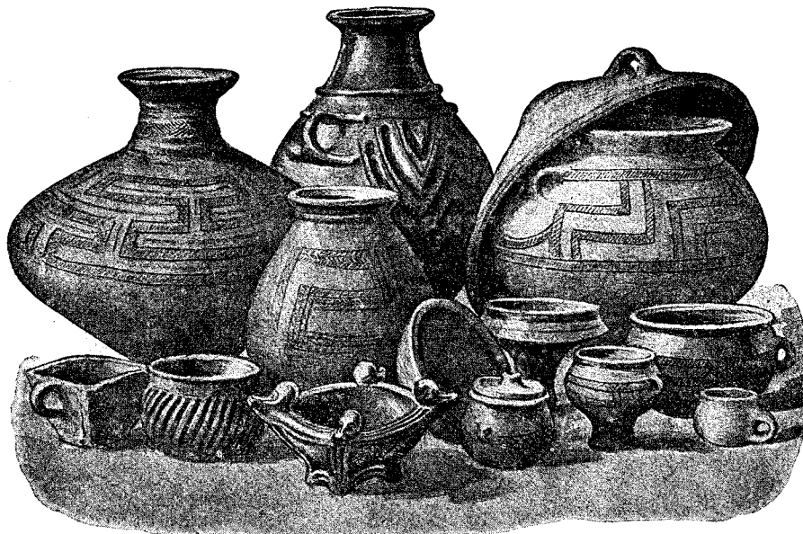
Jyske Lerkar fra den romerske Jernalder.

Gravformer og Gravskikke veksler nu, idet Ligbrænding næsten overalt gaar af Brug, og ved det ubrændte Lig nedsættes forskellige Mad- og Drikkekar af Ler. Her i Hardsyssel dannedes ofte træbyggede Gravkister til Ligene, og ofte blev disse Kister omlagt med Sten. Ved Gaarden Villemoes i Vejrum er afdækket en Grav og Boplads med rigt udstyrede Grave. To særdeles smukke og fyldige Sæt